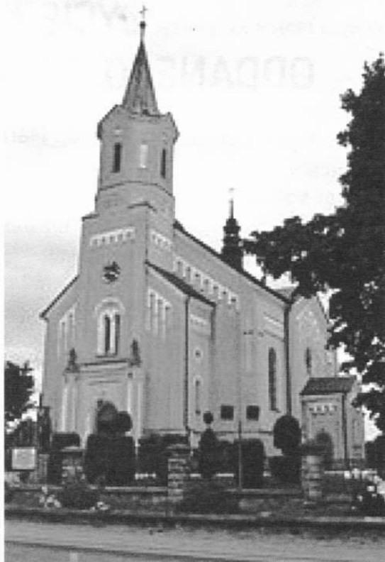
Kościół pw. św. Bartłomieja Apostoła w Padwi Narodowej.